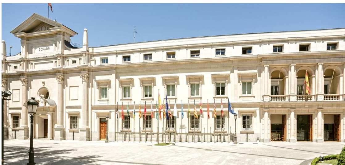
Fachada de la sede histórica del Senado con las banderas de las diecisiete Comunidades Autónomas y las Ciudades Autónomas de Ceuta y Melilla presididas por la del Reino de España.

Como parte del programa de actividades culturales de la A.E.P.T., y como complemento a la visita realizada al Congreso de los Diputados, el pasado jueves 18 de septiembre se realizó una visita guiada a la sede del Senado de España, cuyo edificio tradicional, sito en la Plaza de la Marina Española y que formaba parte del antiguo Colegio de la Encarnación, también llamado Colegio de doña María de Aragón y perteneciente a la orden de los agustinos calzados, fue escogido a partir del año 1835 d.C. como sede del denominado Estamento de Próceres establecido en el Estatuto Real del año 1834 d.C., tras haber acogido su iglesia en el año 1814 d.C. las Cortes unicamerales establecidas en la Constitución del año 1812 d.C.