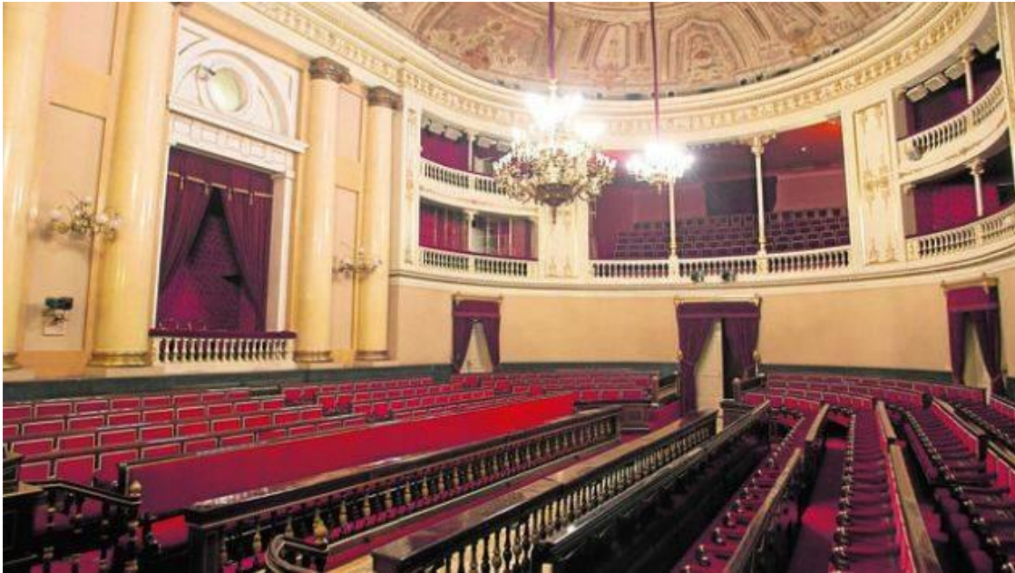
Imagen actual del Salón de Sesiones del Senado.

Su distribución, heredera de las Cortes medievales castellanas en las que la Presidencia era ostentada por el Rey acompañado de sus más fieles consejeros, y que hoy día se conoce como modelo anglosajón, se ajusta al establecido durante la Revolución Francesa, los moderados, en aquellos tiempos los girondinos, ocupan los bancos de la derecha mientras los más "radicales", los jacobinos, lo hacen en los de la izquierda, bancos tapizados en color rojo para diferenciarlos de los correspondientes a los miembros del Gobierno, sentados en la primera fila, que lo están en color azul.