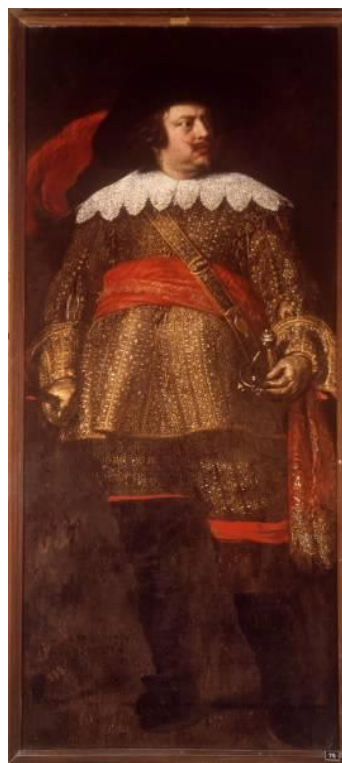
Marqués de la Católica Óleo sobre lienzo obra de Mattia Preti