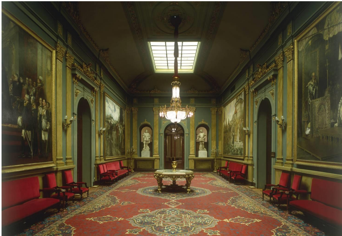
Vista del denominado Salón de los Pasos Perdidos.