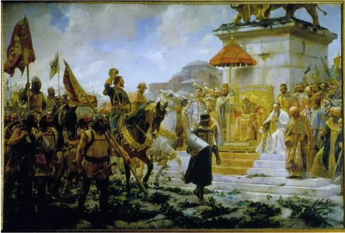
La entrada de Roger de Flor en Constantinopla. / Obra de Manuel Moreno Carbonero.