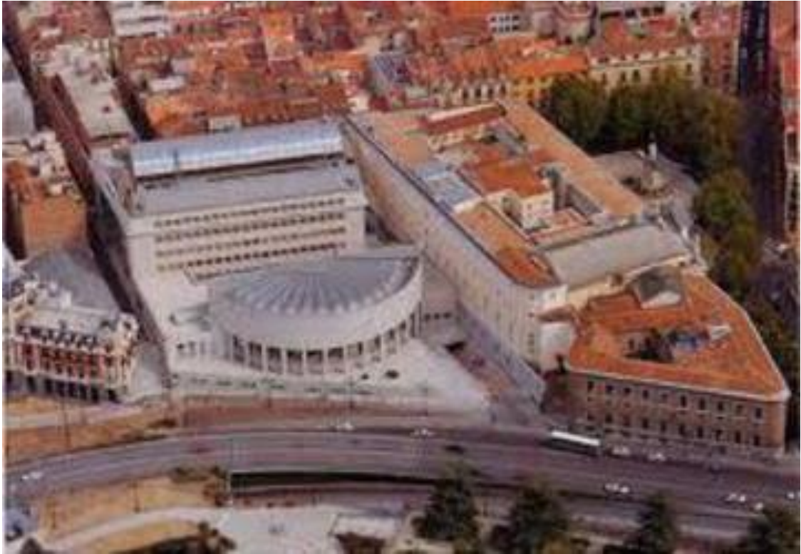
Vista aérea del los edificios del Senado de España