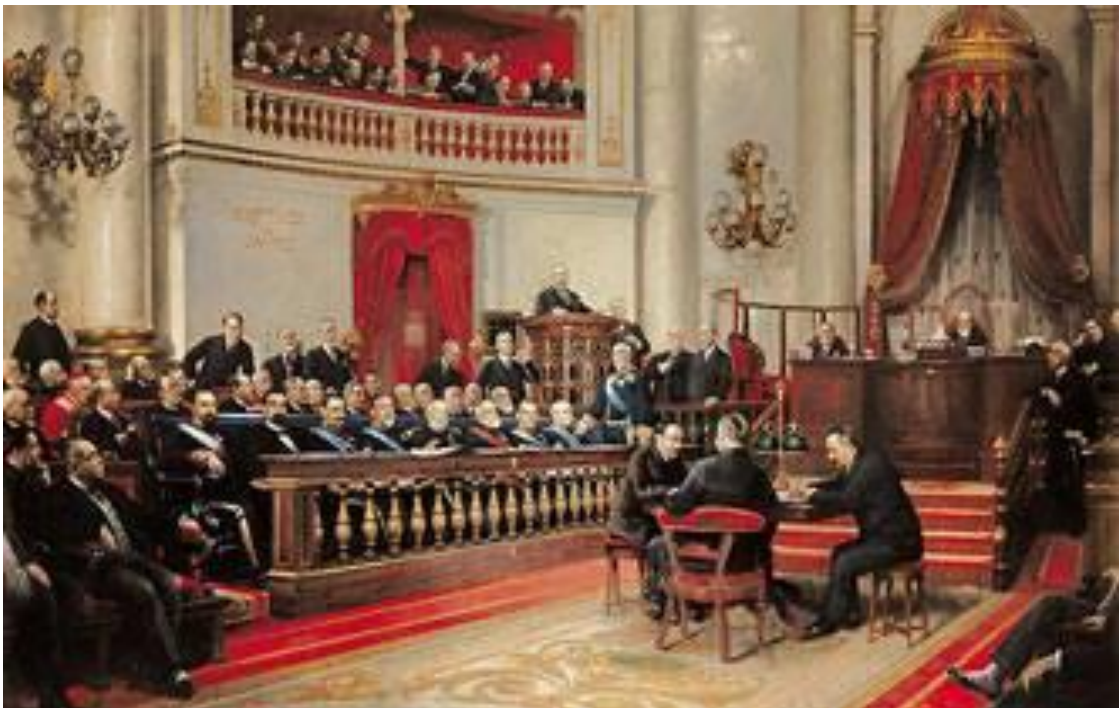
Salón de Sesiones del Senado en el siglo XIX d.C.