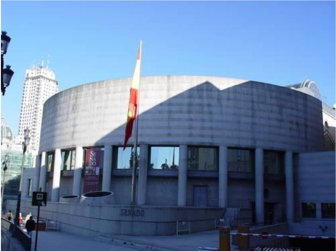
Fachada de la ampliación del Senado.

Y fue por este segundo edificio por el que accedimos a su interior, el cual consta de tres zonas claramente diferenciadas, estando la primera, un edificio de cuatro plantas, cuya fachada se corresponde con la antigua calle del reloj, y al pie de la cual se conservan algunos restos de la cerca medieval de Madrid, se sitúan los despachos de los señores Senadores los cuales, como una antigua corrala madrileña, se asoman a un gran patio de luces, mientras que en el característico cuerpo central semicircular se ubican el nuevo Salón de Sesiones junto a otras salas destinada a las reuniones de las diversas Comisiones, encargándose de articular y unir ambos edificios la tercera zona, en el que se encuentra un antiguo aljibe, motivo de polémica hace unos años cuando, en una desafortunada decisión, se acordó transformarlo en una piscina climatizada para exclusivo uso de los representantes de los ciudadanos.