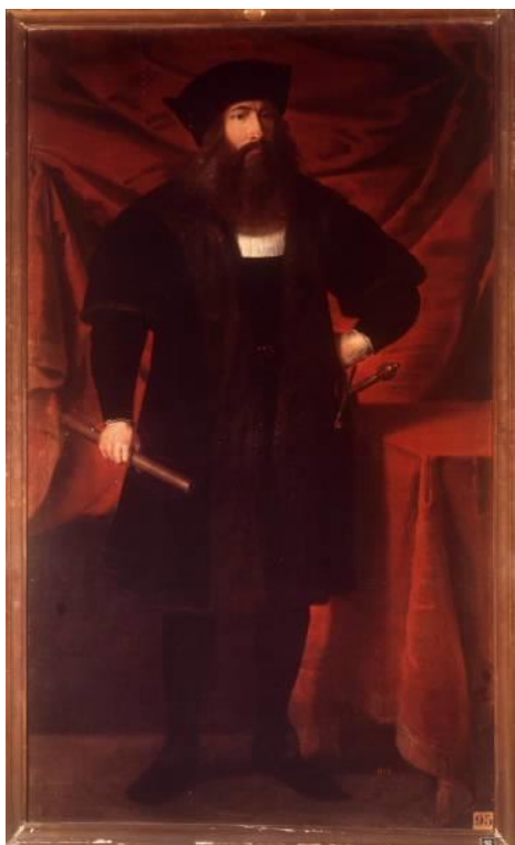
Lautrec, General del ejército francés en Italia. Óleo sobre lienzo de la escuela flamenca.