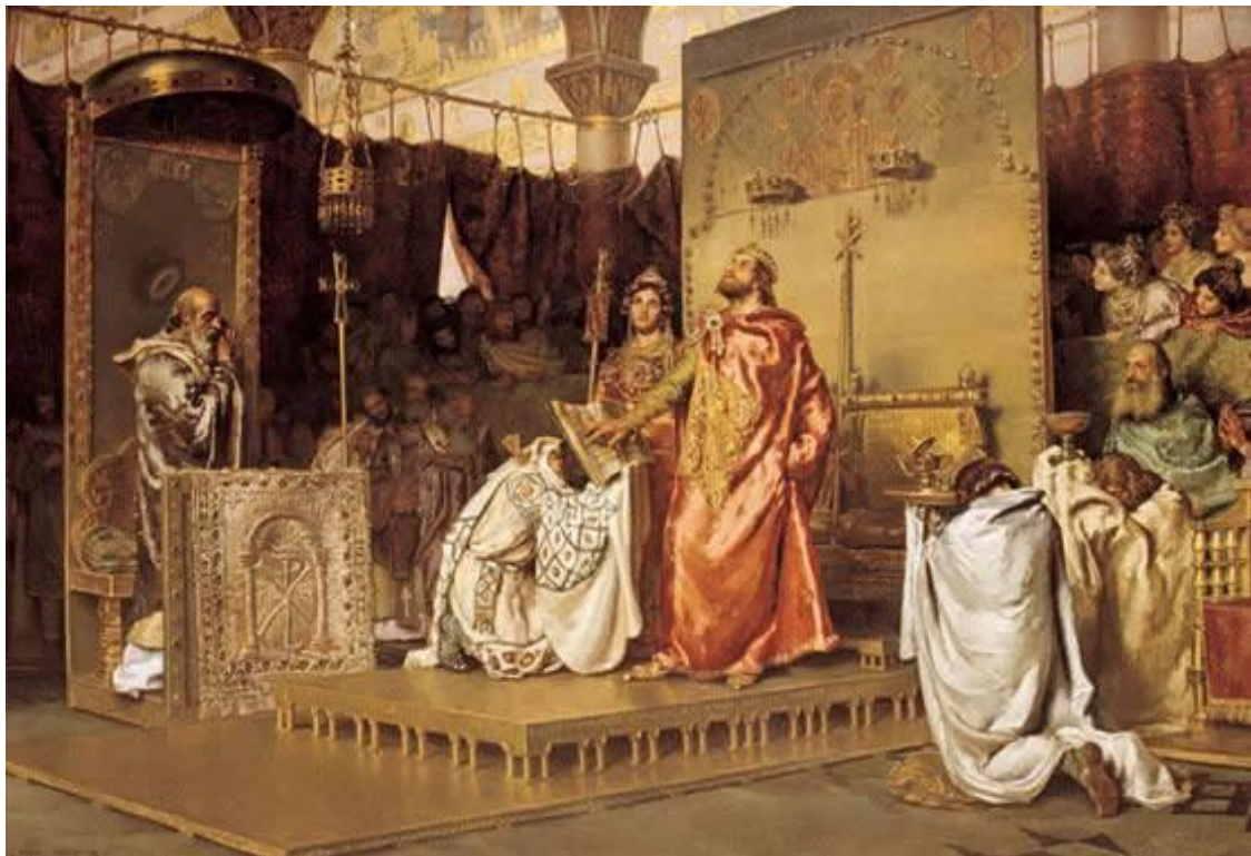
La conversión del rey Recaredo. / Obra de Antonio Muñoz Degrain.

Enfrentada a la anterior encontramos "La rendición de Granada", óleo de Francisco Pradilla y Ortiz, que sublima el momento en el cual el rey nazarí Muhámmad XII, llamado Boabdil el Chico en las crónicas cristianas, entrega simbólicamente las llaves de la ciudad de Granada a los monarcas Isabel I de Castilla y Fernando II de Aragón, los futuros Reyes Católicos, dando fin a la denominada Reconquista.