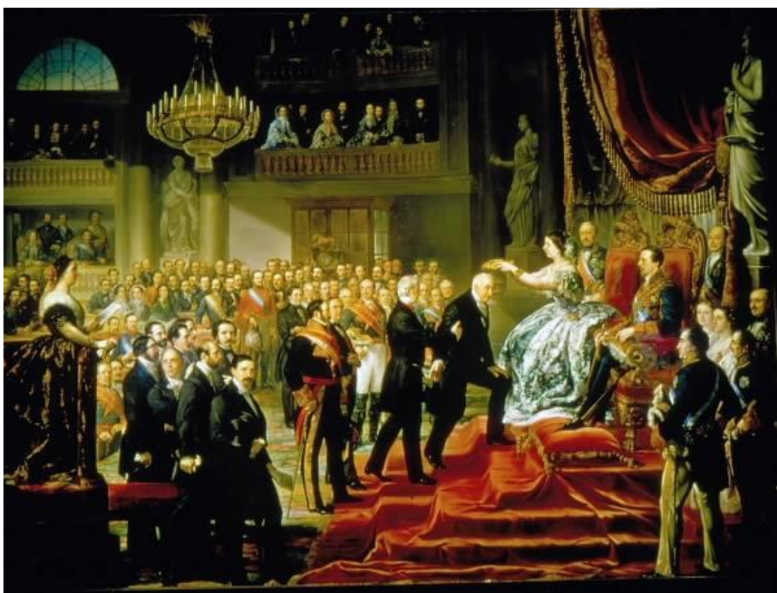
"Coronación del poeta don Manuel J. Quintana", óleo de Luís López y Piquer.