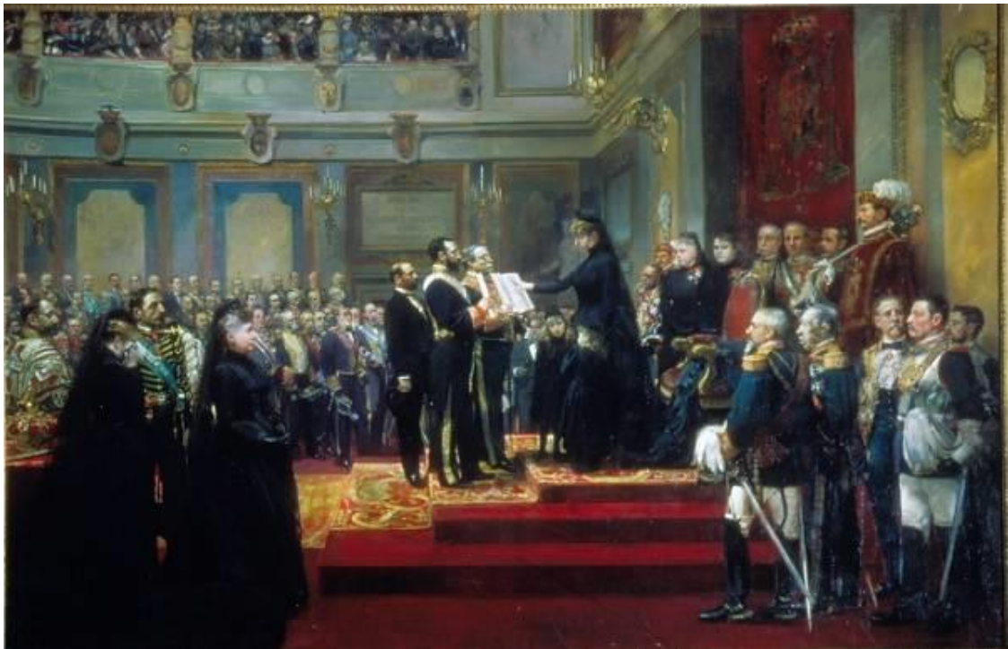
Jura de la Constitución por S. M. la Reina Regente doña María Cristina Obra de Francisco Jover Casanova y Joaquín Sorolla y Bastida.