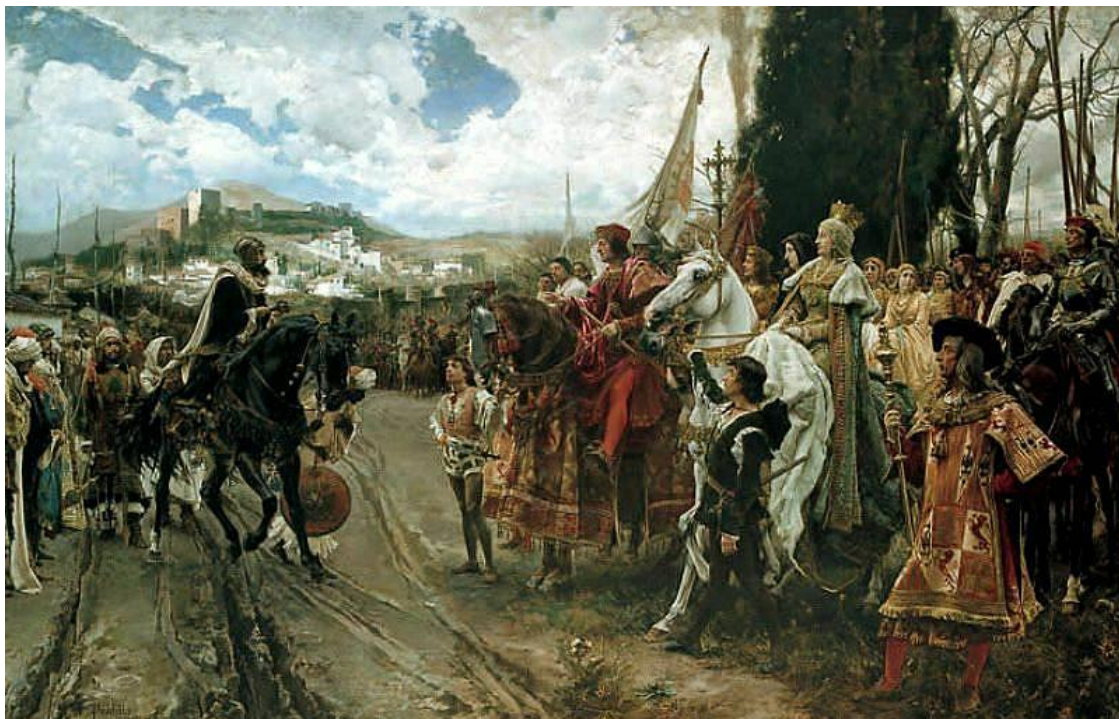
La rendición de Granada. / Obra de Francisco Pradilla y Ortíz.

Hemos dejado para el final el cuarto de los lienzos dado que su historia merece un comentario aparte.