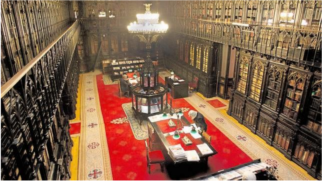
La Biblioteca del Senado de España.

Y en este emblemático lugar se dio por finalizada nuestro recorrido por las Salas y estancias del edificio que acoge la llamada Cámara Alta no sin antes agradecer a nuestra guía la deferencia de acompañarnos en nuestra visita.