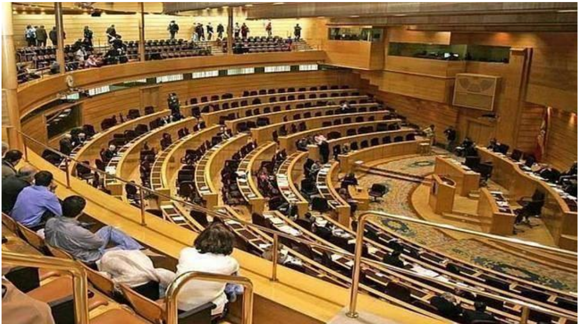
Salón de Sesiones del Senado ubicado en el edificio nuevo.

En los amplios pasillos de comunicación cuelgan, siguiendo la tradición pictórica de la Institución, diversas obras de artistas españoles representativas de los movimientos pictóricos del siglo XX d.C.