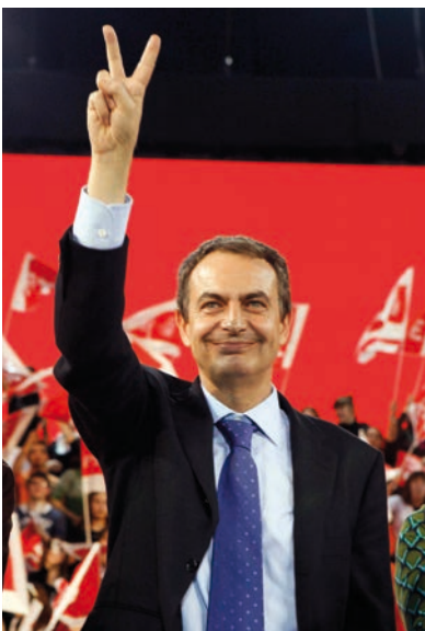
Rodríguez Zapatero pedía para su reelección “vota con todas tus fuerzas”.

Durante el período de ZP (abril 2011), el PSOE, PNV y CiU, votaron en contra de derogar los permisos para realizar prospecciones petrolíferas en el Mediterráneo a 200 km de Mallorca, lo que levantó en pie de lucha a los parlamentarios baleares del PP. Sin embargo, tres años después (mayo 2014), en la presente legislatura, Rajoy y su partido han cambiado radicalmente su postura en contra de las prospecciones, con el anuncio del ministro de Industria, Energía y Turismo, José Manuel Soria , de prospecciones en Baleares, donde ya habían sido autorizadas por la anterior administración, y añadiendo Canarias. Las reacciones de los principales empresarios del sector de ambos archipiélagos, sus respectivas patronales y sus gobernantes no se hicieron esperar, mientras el PP defendía ardorosamente lo que juró que paralizaría en tiempos de Zapatero. Este cambio de postura del PP provocó entonces la ruptura de voto de cuatro parlamentarios ‘populares’ de Baleares, liderados por el entonces presidente de la Comunidad José Ramón Bauzá, que mantuvieron los criterios esgrimidos frente al Gobierno de ZP cuando eran oposición en contra de las exploraciones petrolíferas. ■