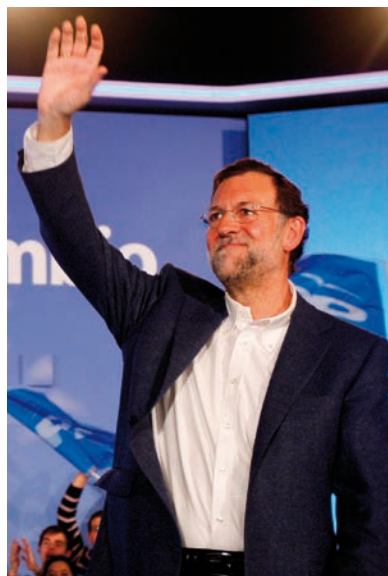
Tras dos legislaturas de su oponente, Rajoy pedía “súmate al cambio”.