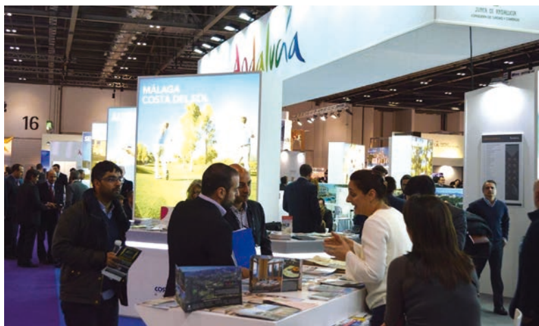
Ciudadanos quiere evitar la duplicidad en aspectos como la promoción turística.

La bajada del IVA turístico y la mejora de la enseñanza de idiomas para los profesionales del futuro son aspectos básicos del programa que Ciudadanos propone al sector. También su apuesta por reducir el gasto público mediante la eliminación de entes que consideran innecesarios, como las diputaciones provinciales, así como la interrupción de toda inversión en infraestructuras de transporte cuyo retorno no esté garantizado.