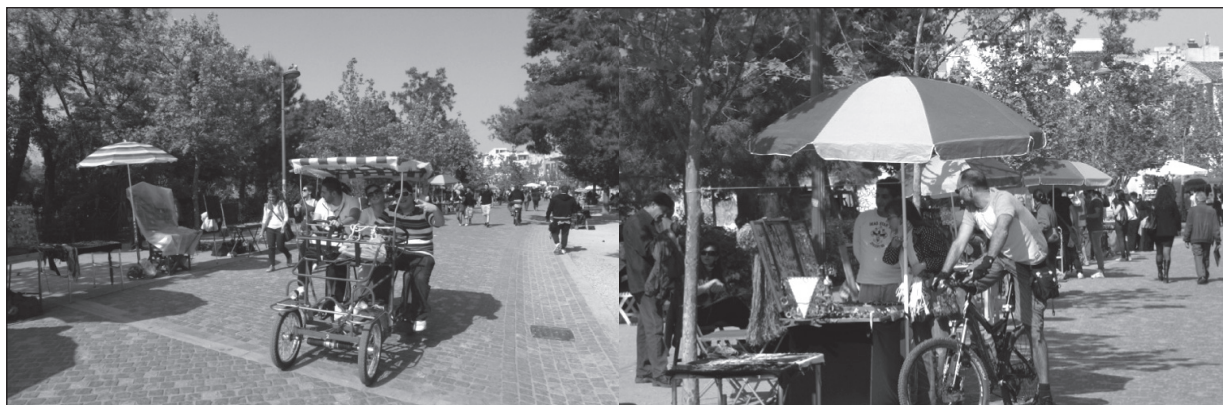
Figuras 3 y 4

La ruta peatonal también le da acceso al Odeón de Herodes Atticus también conocido como el Teatro de Irodion (figuras 5 y figura 6). Esta estructura de teatro en pie-